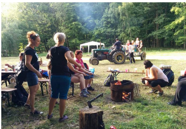
Den dětí na Ostrovci - u ohně se opékají špekáčky, na louce se vozí děti na traktoru a v bezpečně vzdáleném altánu střílejí vzduchovky.