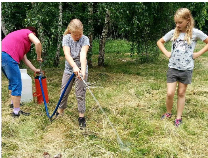
Den dětí na Ostrovci - kromě traktorů, vzduchovek a dalších atrakcí si děti užily i ručního hašení ze džberovky. Více nejen o této akci na straně 10 a 11.