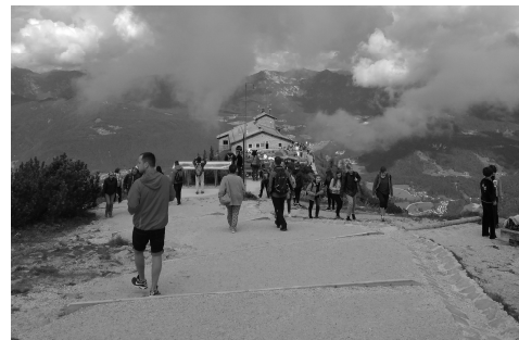
L. Kračinová, vyučující německého jazyka ZŠ Mysločovice

Díky počasí, příjemným lidem a skvělému servisu (autobus, pan průvodce, ubytování, strava) se stal pobyt pro všechny zúčastněné nezapomenutelným zážitkem, za který děkujeme výše zmíněným dárcům.