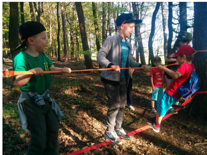
Chůzi po laně zvládali malí parašutisté na Dětské Clay-Eva zcela bez problémů.