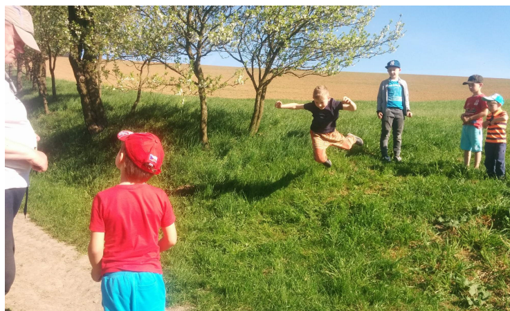
Mezi aktivity účastníků Dětské Clay-Eva patřil i nácvik parakotoulu. Na husté měkké trávě je přece jen bezpečnější než na kamenité cestě :-).