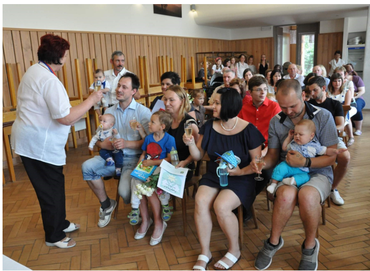
Na závěr milé slavnosti cinkají při přípitku číše vína.