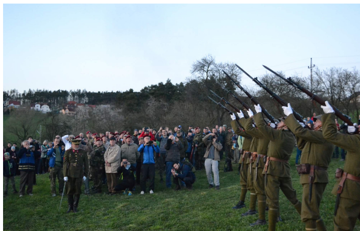
Čestná salva a historická Československá hymna ukončily oficiální zahájení nočního pochodu ve stopách Clay-Eva.