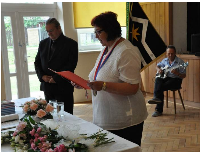
Starostka obce slavnostně vítá nové občanky Hostišové.