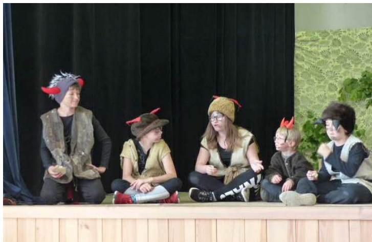
Válečná porada čertů - jak si poradit s divokými Hostuškami. Děti z Hostišové prostě mají divadelní talent (a dobré vedení!).