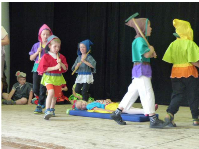
Hej hou, hej hou a trpaslíci jdou - a Sněhurka spí! Jak to, milé maminky, asi dopadne?