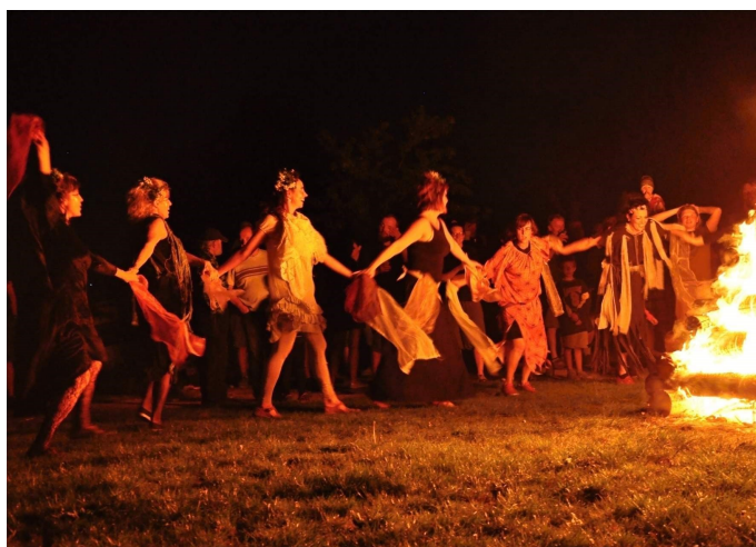
Magický rej těch velkých čarodějnic působil až strašidelně. Ale taky krásně!