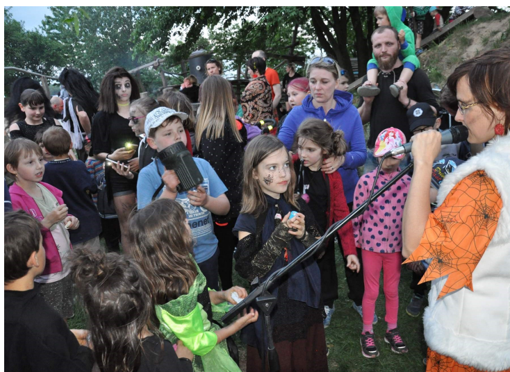
Malými čarodějnicemi se to na Strážné jen hemžilo.