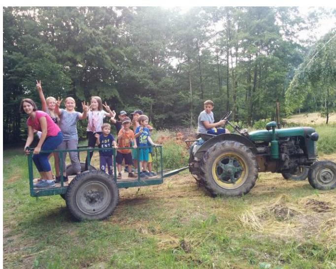
Dopravní podnik Hostišová, linka Ostrovec východ - Ostrovec západ a zpět.