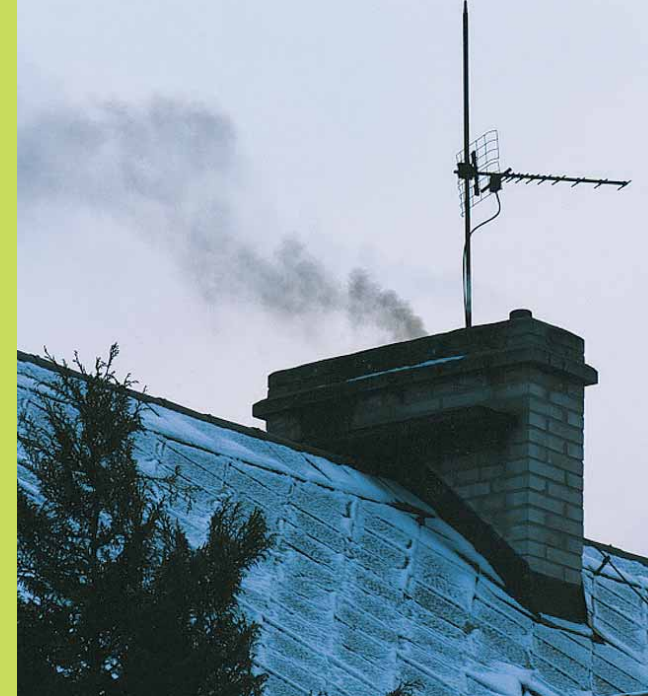
Spalováním odpadu či nekvalitních paliv v domácím topeništi produkuje množství toxických látek, které poškozují vaše zdraví.